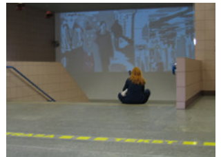
Meeting-01.tif-Hintergrund.tif (5.546 KB > 14 MB, 300 dpi, 22 x 16,5 cm)