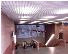
W-Auffahrt-oben1.tif (664 KB > 1,2 MB, 300 dpi, 4,8 x 6,1 cm)