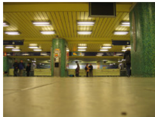
IMG_1818.jpg (364 KB > 3,5 MB, 300 dpi, 10,8 x 81 cm)