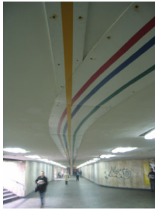
IMG_1903.jpg (191 KB > 3,5 MB, 300 dpi, 8,1 x 10,8 cm)