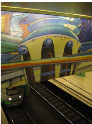
IMG_1072.jpg (463 KB > 3,5 MB, 300 dpi, 8,1 x 10,8 cm)