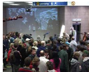
W-Eröffnung3-Rede6.tif (797 KB < 1,2 MB) 300 dpi, 6,1 x 4,9 cm)