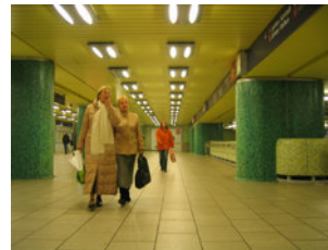
IMG_1834.jpg (354 KB > 3,5 MB, 300 dpi, 10,8 x 8,1 cm)