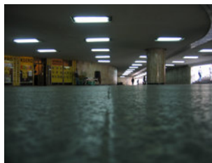
IMG_1006.jpg (214 KB > 3,5 MB, 300 dpi, 10,8 x 81 cm)