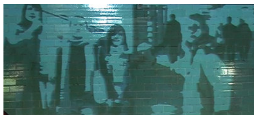
B-Besucher+Mann3-1.tif 388 > 666 KB