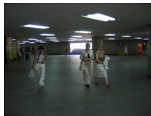
IMG_0996.jpg (241 KB > 3,5 MB, 300 dpi, 10,8 x 8,1 cm)