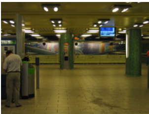
IMG_1067.jpg (312 MB > 3,5 MB, 300 dpi, 10,8 x 8,1 cm)