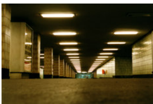
Hintergrund Passage.tif 6.019 KB > 9 MB, 300 dpi,