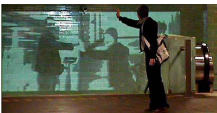
B-FrauMannKomm3.jpg 148 KB > 1,2 MB, 300 dpi, 4,9 x 6,1 cm)