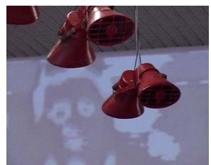
W-LSpr-nah+Wand.tif (557 KB > 1,2 MB, 300 dpi, 4,9 x 61 cm)