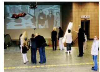
W-Bes+Wand2.tif (3.916 MB > 5 MB, 300 dpi, 8,8 x 14,1 cm)