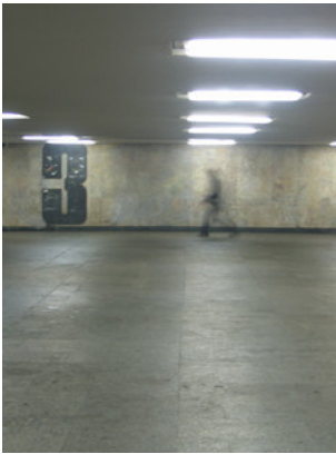
IMG_1911.jpg (210 KB > 3,5 MB, 300 dpi, 8,1 x 10,8 cm)