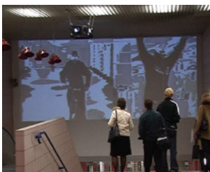
W-B11.tif (1.224 KB > 1,2 MB, 300 dpi, 6,1 x 4,9 cm)